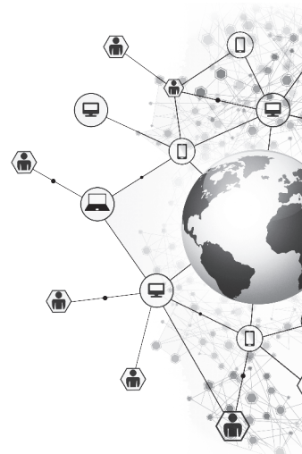
Cuadro 2. Nociones relacionadas con la globalización 2