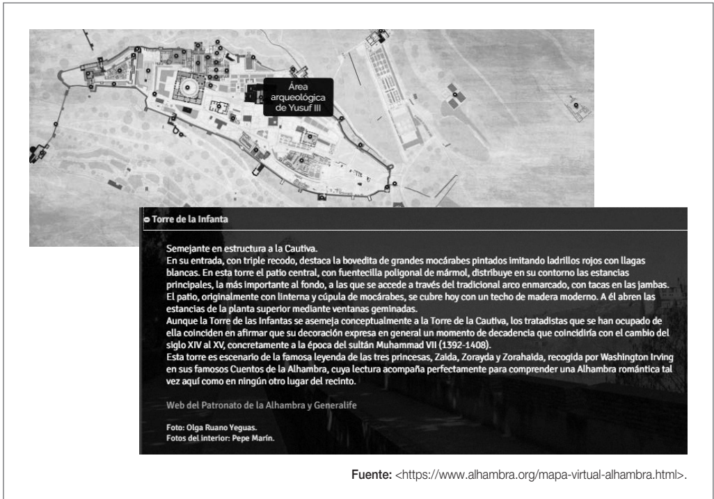
Figura 5. Capturas de pantalla del tour virtual de la Alhambra

Las limitaciones de este ejemplo son evidentes, ya que, aunque refiere gran cantidad de información sobre los diferentes espacios, esta resulta densa, poco motivadora y una copia directa de la información textual contenida en la web del Patronato de la Alhambra. Es un tipo de visita virtual que, como explica Sabbatini (2003), resulta sencilla y asequible, pero adolece de una falta de interactividad, interés y motivación para el visitante.