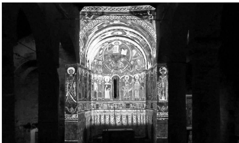
Figuras 8. Captura de pantalla del vídeo «Making off #taull1123. Procés del mapping». Proyectores encendidos