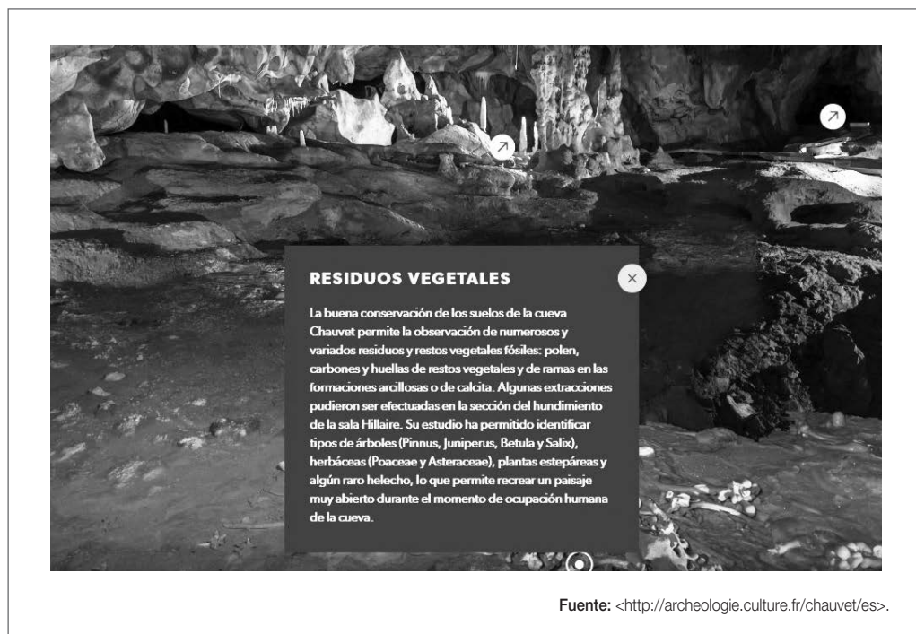
Figura 6. Captura de pantalla del tour virtual de la Cueva Chauvet-Pont d'Arc

El caso de Chauvet-Pont d'Arc reúne, por lo tanto, dos de los requisitos más importantes para entornos virtuales enumerados por Bellido (2001), que son posibilidad de inmersión e interactividad, así como una de las grandes ventajas señaladas por Ortiz (2011) para el uso de las nuevas tecnologías en los procesos educativos, como es la interdisciplinariedad.