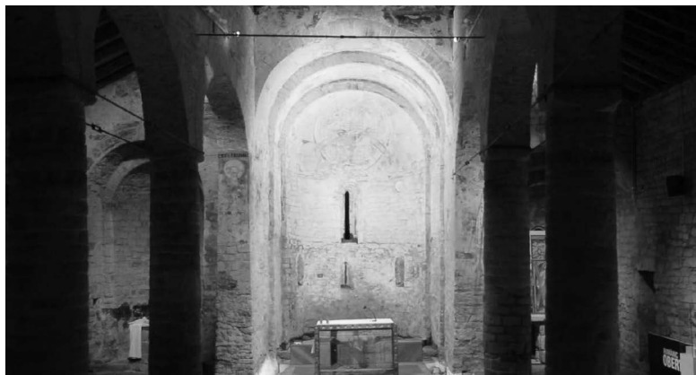
Figuras 7. Captura de pantalla del vídeo «Making off #taull1123. Procés del mapping». Proyectores apagados