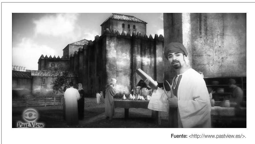
Figura 9. Captura de pantalla de la web de la empresa Past View

Las secuencias se inician normalmente con un fragmento de vídeo, consistente en la recreación histórica del lugar a manos de un personaje. Este personaje, un actor caracterizado de forma diferente dependiendo de la época, se dirige al visitante para hablarle sobre aspectos y contenidos relacionados con la época histórica tratada y con el espacio en el que se encuentran. A su espalda, se puede observar la reconstrucción histórica del espacio y se ven otros personajes secundarios que animan, ambientan el vídeo e interactúan con el narrador (véase figura 9).