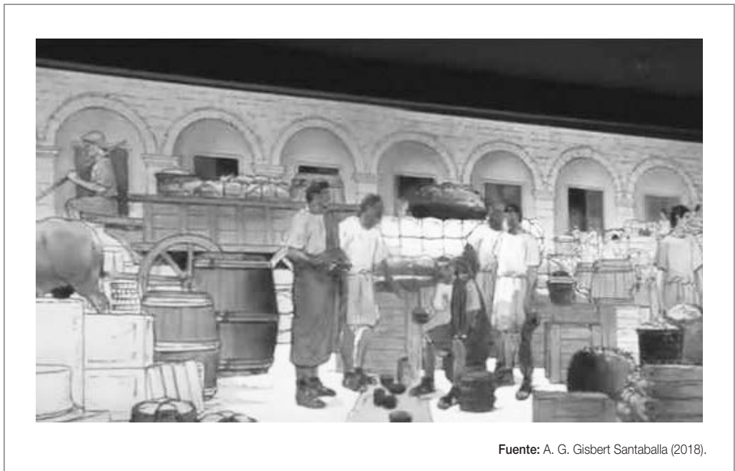
Figura 3. Puerto Fluvial de Caesaraugusta