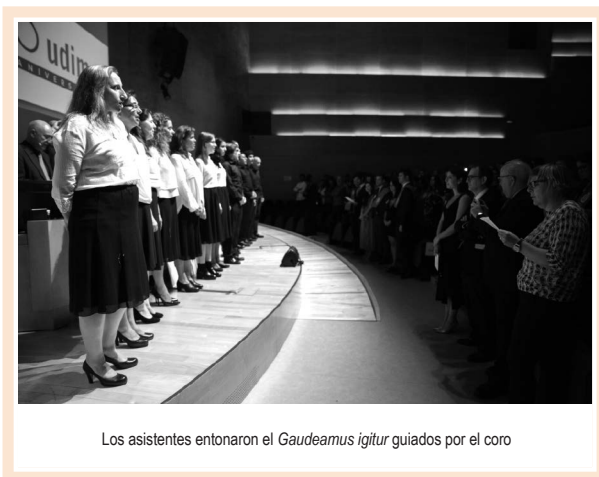
Los asistentes entonaron el Gaudeamus igitur guiados por el coro

Instantes después, cantamos a coro el Gaudeamus igitur , que le daba todavía un mayor rigor académico a este evento; y, finalmente, ya en el exterior de la sala, compartimos las delicias de los platos –calientes y fríos– de un catering ofrecido en la planta baja, con alumnos, familiares y amigos, en un clima de la mayor cordialidad, respeto y fraternidad. Una brillante ceremonia que puso un broche de oro al curso académico 2017-2018.