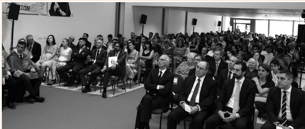
Panorámica de los asistentes al acto en la sede central de la Universidad, con los miembros del Consejo de Administración en primer término