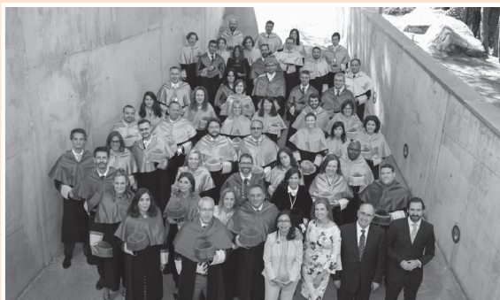
Los doctores de la UDIMA junto con la madrina de la promoción y la presidencia posaron momentos antes de la ceremonia