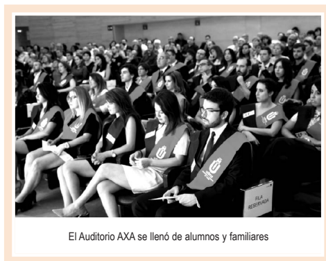
El Auditorio AXA se llenó de alumnos y familiares