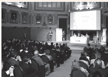
Panorámica del salón de actos del Ateneo de Madrid