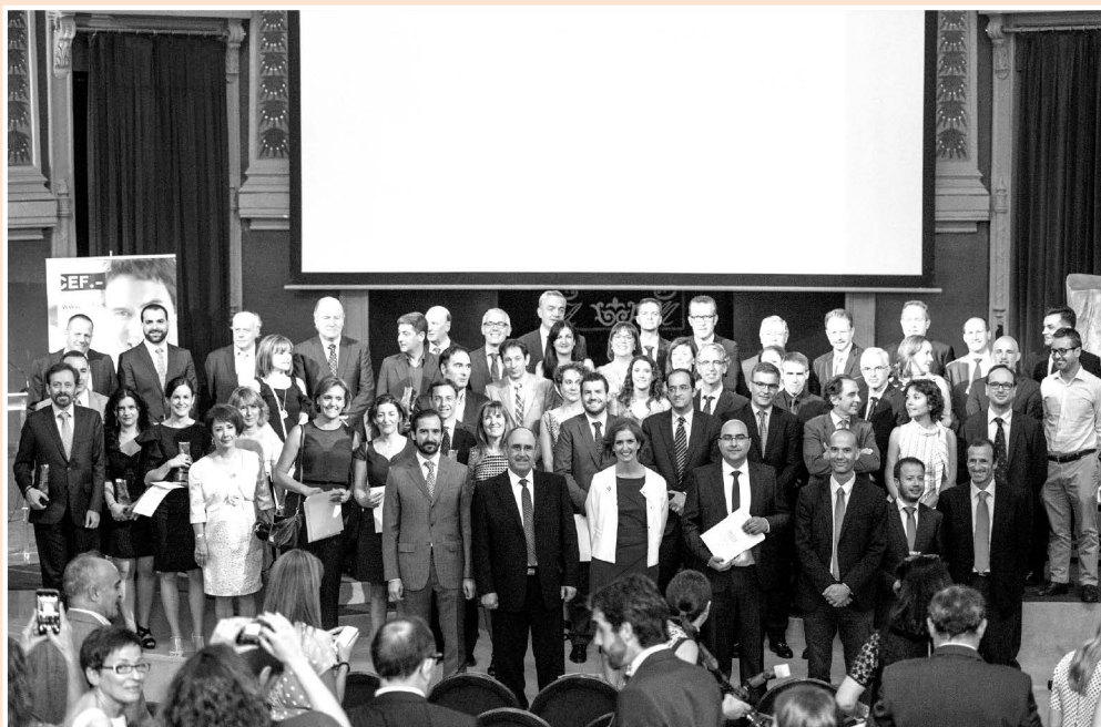
El presidente y los directores generales del Grupo CEF.- UDIMA posaron junto a los premiados al finalizar el acto